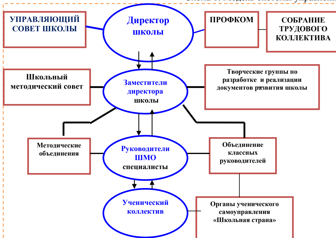
Таблица 2. Органы управления, действующие в Школе